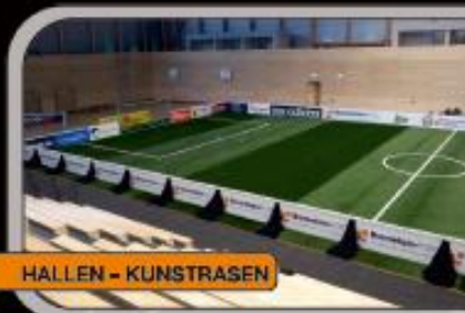
HALLEN - KUNSTRASEN