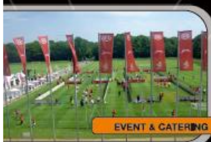
EVENT & CATERING